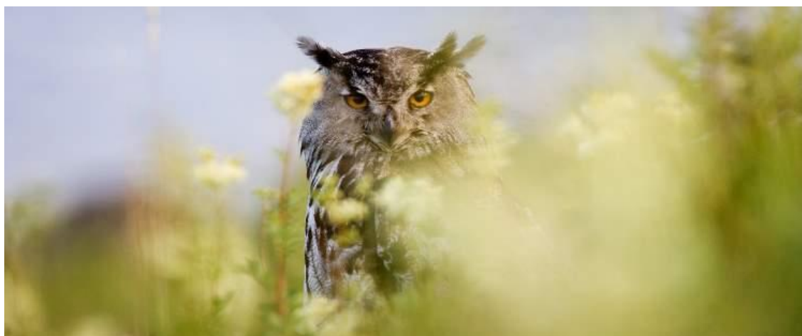
Hubro i blomstereng.