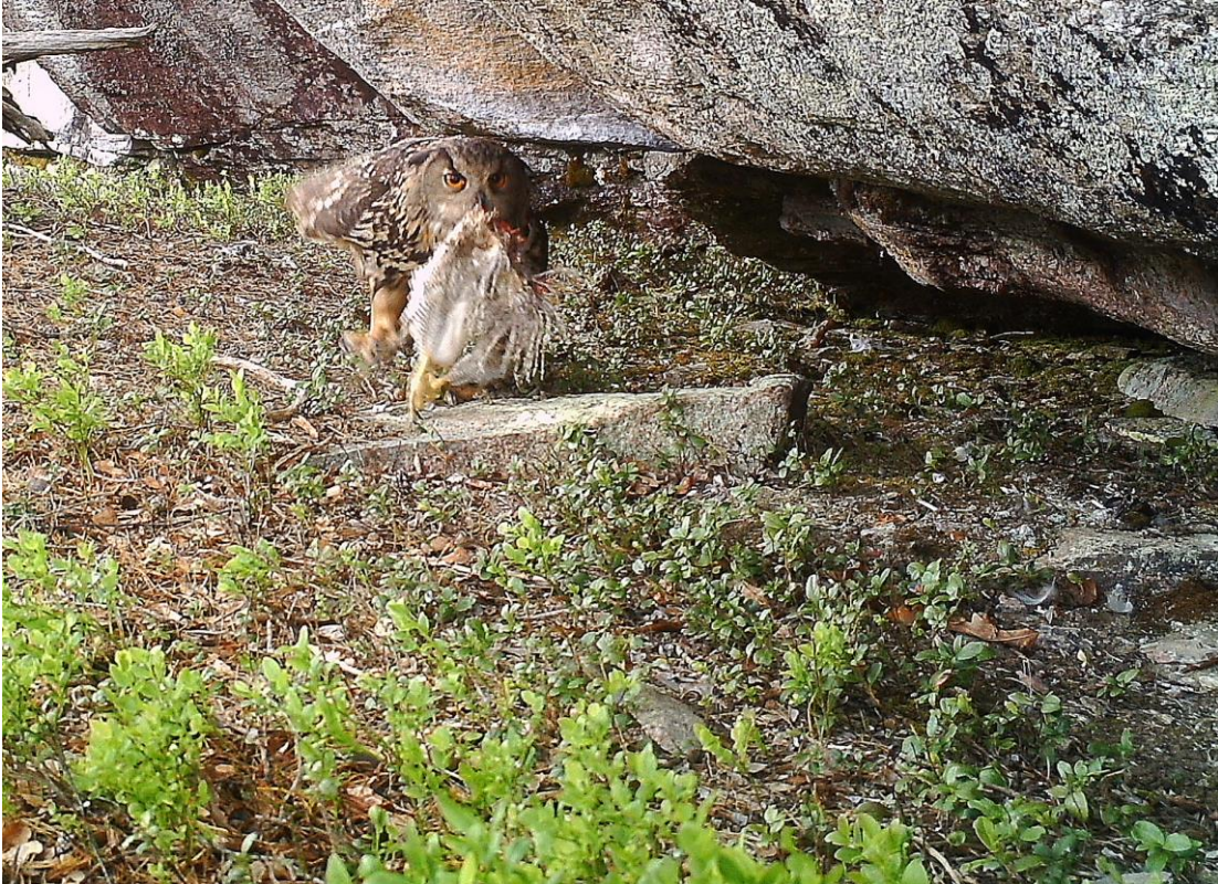
Viltkamera-bilde fra reirplass i Telemark.