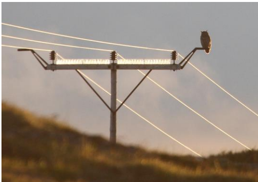
Hubro prøver ut sittepinne på strømmast.

Hubro har store territorier, er geografisk spredd over store deler av landet og vil i tillegg bevege seg over større områder enn territoriet utenfor hekkeperioden (se kapittel 2). Det er derfor ikke mulig å eliminere faren for elektrokusjon og kollisjon for hele landet og tiltakene må fokusere på kjerneområdene. Derfor må videre tiltak fortsatt prioritere aktive hubroterritorier. Ideelt vil det ha størst effekt å sikre de mest produktive territoriene, men kunnskap om hekkesuksess er i liten grad tilgjengelig utenfor overvåkingsområdene. Fokuset må derfor være på territorier som oppfyller krav til å være okkupert i Rovbase 3.0. (i henhold til feltinstruks for nasjonal overvåking av hubrobestanden). Innenfor territoriene vil det fortsatt være viktig å prioritere kjente reirhyller og tiltak innenfor en radius på 2 km rundt disse.