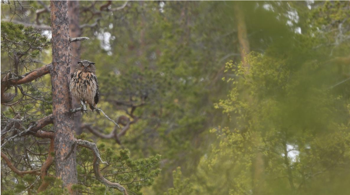
Hubro på sittepost.

Manglende kunnskap om hubroforekomster, i tillegg til manglende forståelse for artens biologi hos ansvarlig forvaltningsmyndighet (primært kommunal forvaltning), kan føre til at nødvendige hensyn ikke blir tatt i saksbehandling og arealplanlegging.