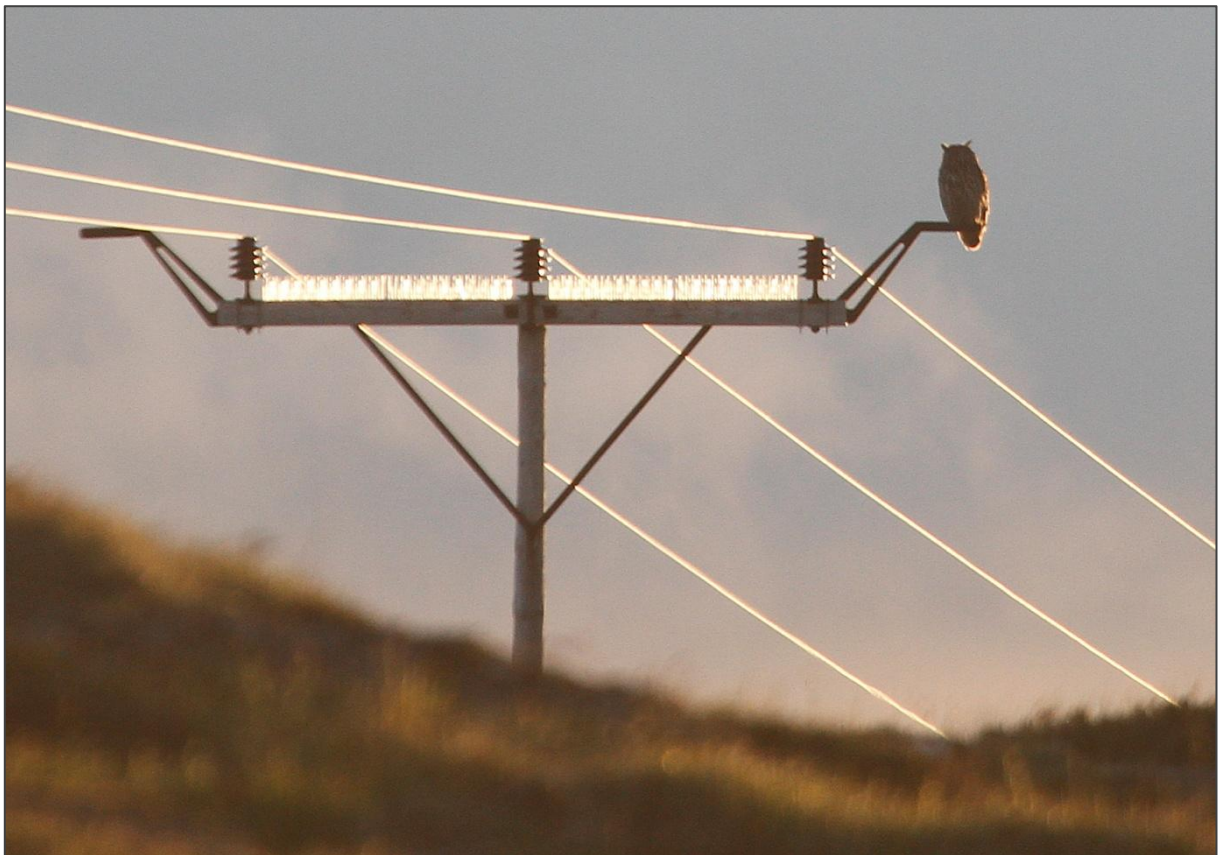
Hubro sitter på sittepinne i Lurøy kommune

fra 1 – 10. Konklusjonene etter analyser av data var at det nesten ikke var vånd på øyer med sau. Spor tegn etter vånd ble kun registrert i små områder i kantsoner og på starrmark. Hovedutbredelsen av vånd var i grasmark på øyer uten sau.